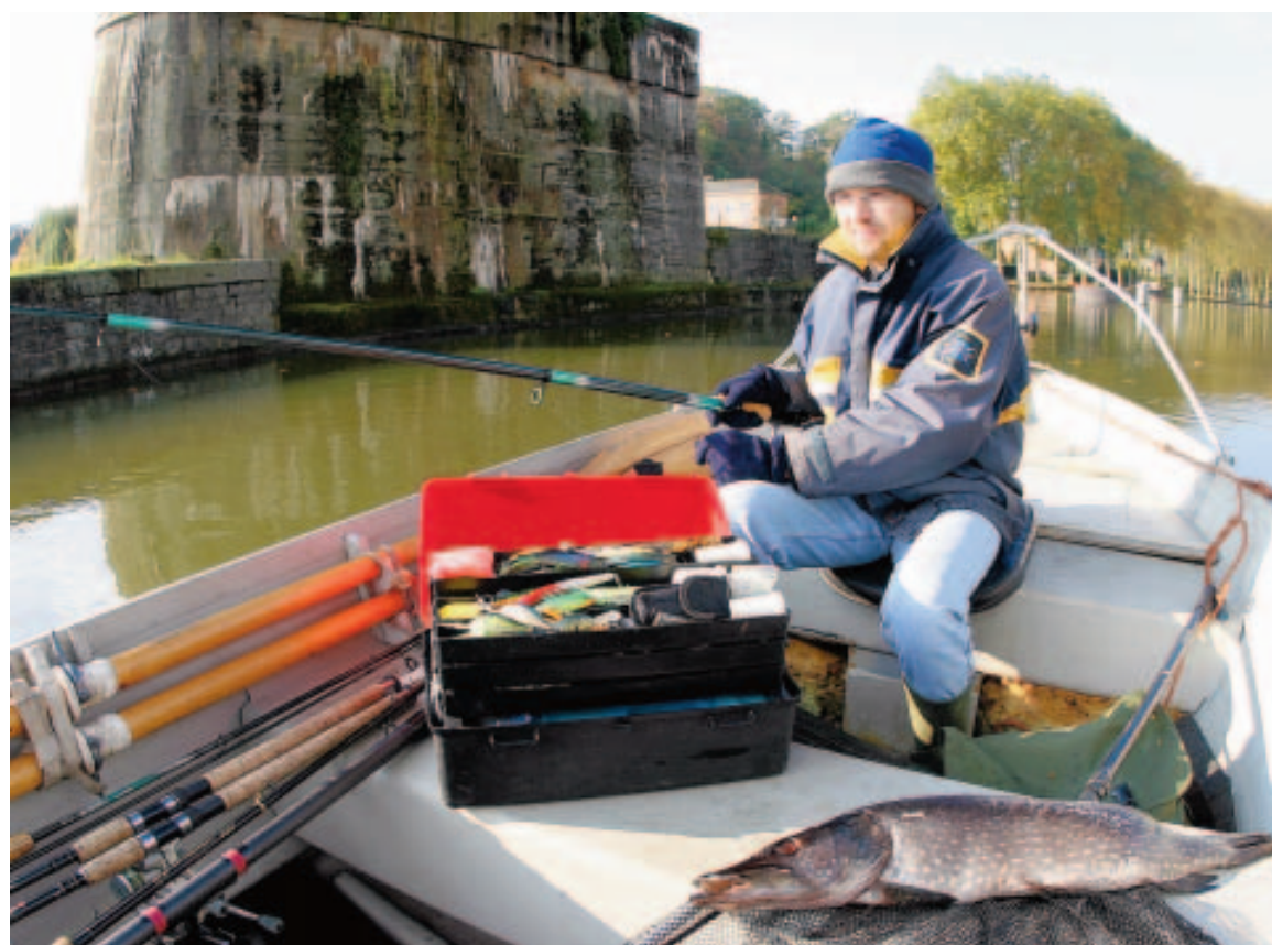
À chaque situation et à chaque type de proie son leurre. Mieux vaut être outillé... ■ Y.Z.

De multiples facteurs peuvent influencer les performances d'un leurre: profondeur, clarté de l'eau, vitesse de récupération, taille et poids du leurre. Des leurres de fréquence et d'intensité différentes peuvent donc parfaitement être performants un jour et décevants le lendemain. Comme nous l'avons vu la semaine passée, le son constitue une vibration, mais toutes les vibrations ne sont pas nécessairement des sons. Le cliquetis que perçoit le pêcheur en agitant le nouveau leurre qu'il vient d'acquérir, le poisson ne l'entend pas de la même oreille. Il ne faut donc surtout pas juger ce type de leurre sous un